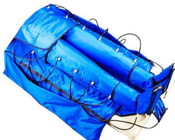
Esempio di applicazione dei gambali con marsupio ACC.971M

ACC.971M Serie completa gambali con marsupio